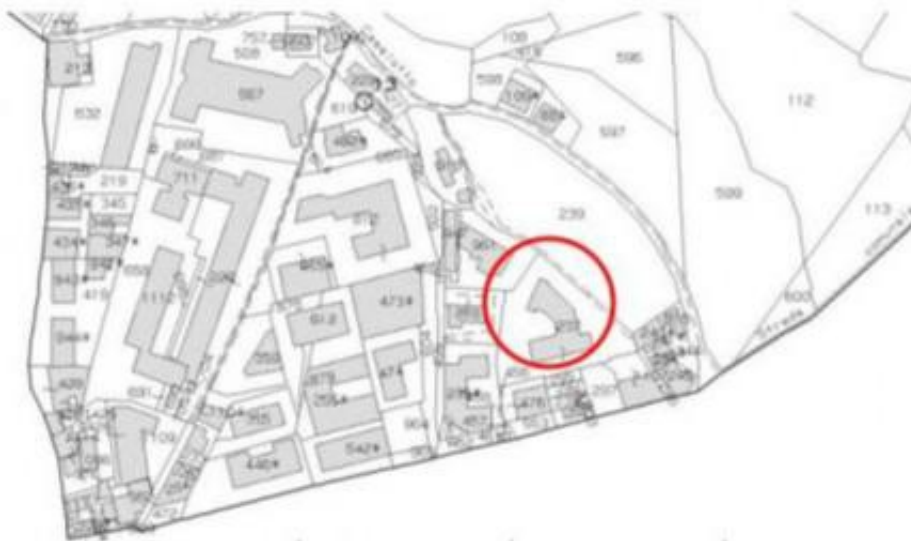
Estratto di mappa